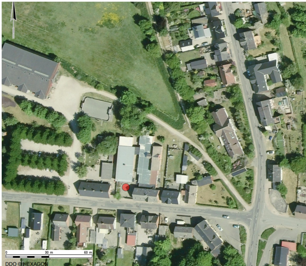
Luftfoto visende ejendommens beliggenhed - Ansøgte fitnessredskaber placeres ved rød prik

Norddjurs Kommune meddeler hermed landzonetilladelse efter planlovens § 35, stk. 1, til opsætning af fitnessredskaber på ejendommen beliggende Stendyssevej 6-10, Stenvad, 8586 Ørum Djurs - Matr.nr. 3 cv Ulstrup By, Ørum